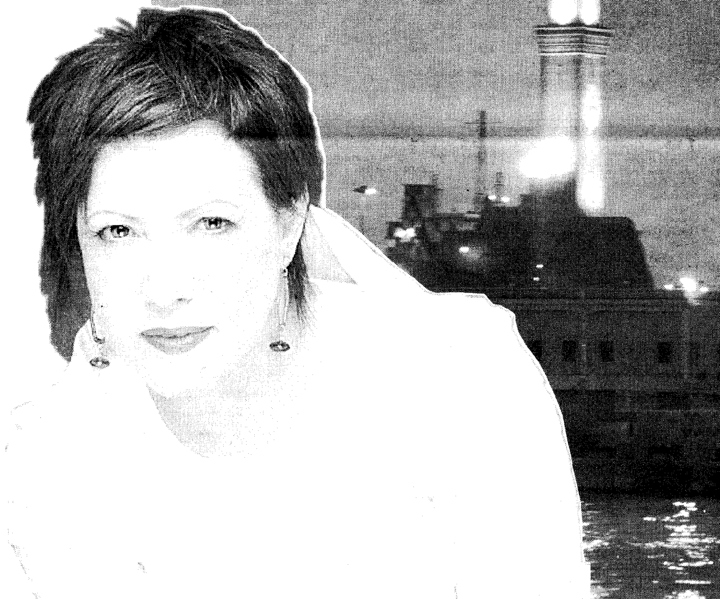
Antonella Ruggiero si esibirà domani al Palazzo della Borsa, nell'anteprima del suo nuovo cd, "Genova la Superba"